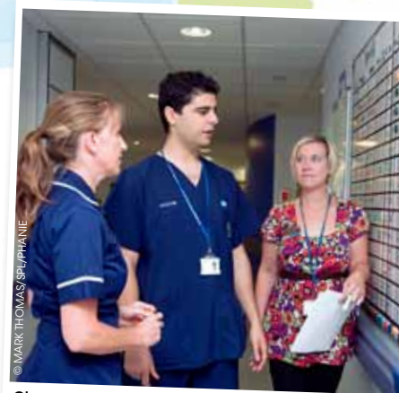
Chaque année, tous les médecins britanniques seront soumis à une évaluation au sein de leur établissement.

Cette nouvelle mesure préfigure le processus de revalidation , qui devrait démarrer en mars 2012. Le principe: tous les ans, chaque médecin sera soumis à une évaluation au sein de son établissement. Ce sera à lui de fournir les éléments montrant qu'il exerce son métier conformément aux principes du Good Medical Practice , mais aussi dans le respect des recommanda-